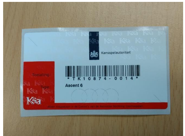
Voorbeeld van een modern Ksa-merkteken

Het merkteken geeft aan op welke locaties een speelautomaat mag staan. Er zijn vier verschillende soorten (speelcasino's, speelautomatenhallen, hoogdrempelige horeca en behendigheid) met elk hun eigen opstellocaties.