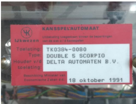
Voorbeeld van een ouderwets merkteken (IJKwezen/Ministerie van EZ)

De merktekens zijn in de loop van de tijd enigszins van uiterlijk en opschrift veranderd. Op moderne merktekens wordt de Kansspelautoriteit genoemd, op oudere staat de Minister van Justitie of zelfs de Minister van Economische Zaken 10 . Uiterlijke verschillen zijn niet belangrijk: het gaat om de soort. Ter illustratie hieronder voorbeelden van een oud en modern merkteken. Beide betreffen casino-automaten (rood merkteken, TK-nummer)